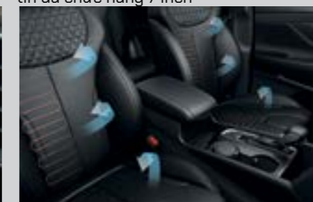
Sưởi và thông gió hàng ghế trước