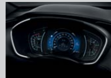
Màn hình công tơ mét điện tử 8 thông tin đa chức năng 7 inch