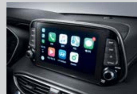
Màn hình cảm ứng 8 inch tích hợp Apple Car Play

Không gian sử dụng linh hoạt: Với khả năng gập 50:50 của hàng ghế thứ 3 và 60:40 của hàng ghế thứ 2, SantaFe đem đến cho bạn khả năng linh hoạt về không gian sử dụng. Khi dựng cả 3 hàng ghế, bạn sẽ có một chiếc SUV 7 chỗ rộng rãi cho tất cả các vị trí ngồi.