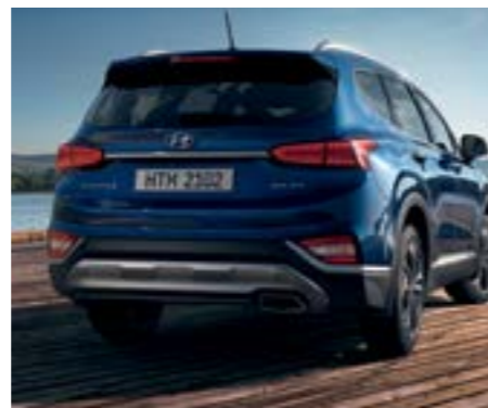
Đèn hậu công nghệ LED 3D