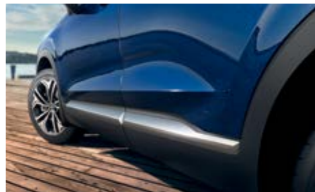
Ốp hông nổi bật