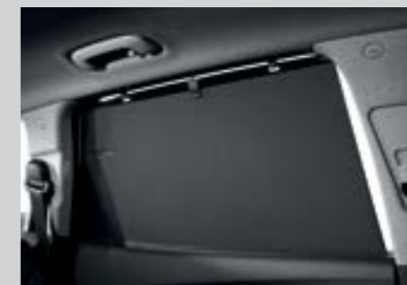
Rèm cửa ghế sau