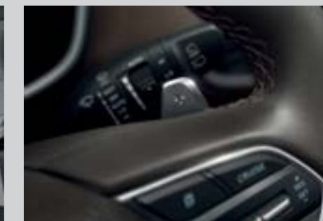
Lấy chuyển số trên vô lăng