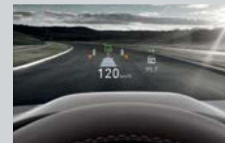
Hiển thị thông tin kính lái HUD