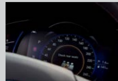
Cảnh báo người ngồi hàng ghế sau ROA