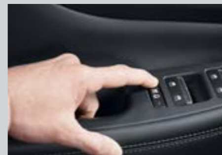
Khóa an toàn trẻ em SEA