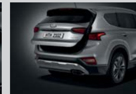
Cốp điện thông minh mở tự động