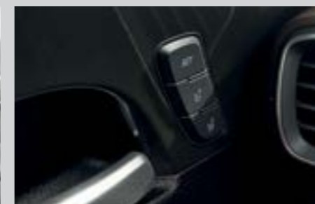
Nhớ ghế lái 2 vị trí