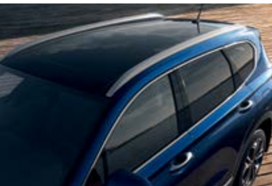
Thanh đỡ giá nóc

Thiết kế nổi bật với cụm đèn Bi-LED chiếu sáng được bố trí đặt thấp, dải đèn LED ban ngày sắc sảo cùng lưới tản nhiệt thác nước Cascading Grill đặc trưng.