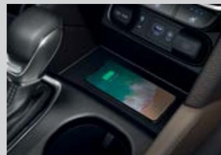
Sạc điện thoại không dây chuẩn Qi